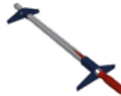
TerrassenFix® Zwing III