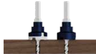
TerrassenFix® Bohrsenker BS 5 & BS 6