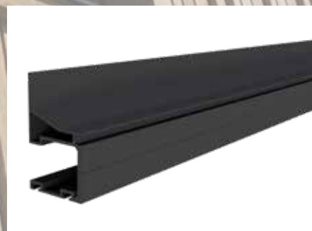
TefaFix ® F Aluminium SC 9-beschichtet