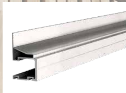
TefaFix ® F Aluminium blank