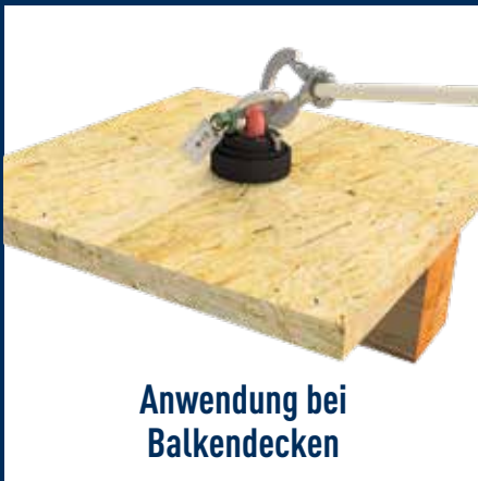
Anwendung bei Balkendecken