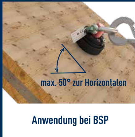
Anwendung bei BSP